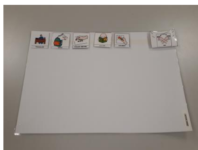
Set de table de travail